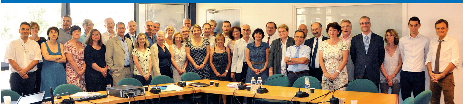
La 1 ère réunion du Comité stratégique s'est déroulée le 8 juillet en présence des représentants de tous les établissements