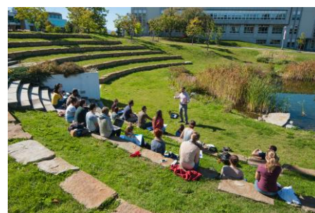
Campus de Sherbrooke