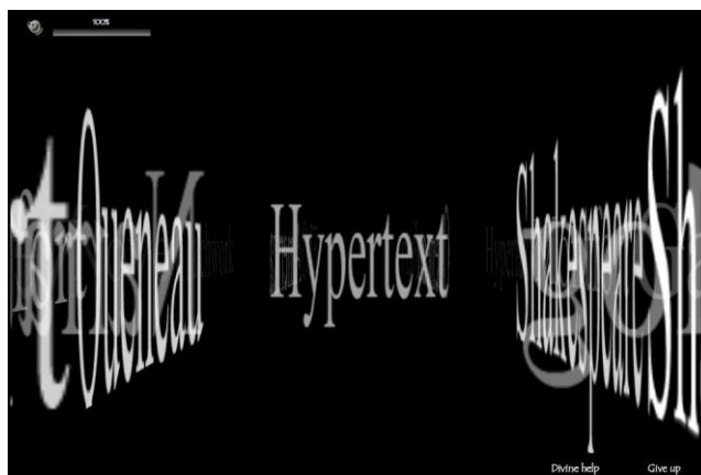
Figure 2. Le sanglier d'Erymanthe.

Cette œuvre s'inscrit dans une mythologie de la vie quotidienne, consistant non pas à mettre en scène le tragique de l'existence, mais à mythifier nos activités les plus quotidiennes. Mythifier nos activités, cela consiste à les mettre à distance pour pouvoir les démythifier, mais dans le même temps à les transfigurer. Il s'agit par là même de vivre notre rapport à la technologie sur un mode épique... non dénué d'humour, nous l'espérons.